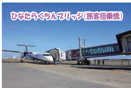
ひなたらくちんフリッジ(旅客搭乗橋)

また、役職員一同で「心のバリアフリー」を目指し、ソフト面、ハード面の両方から「心のこもった思いや り」の気持ちで空港利用者へサービスを行われています。 「福祉のまちづくり」を目指す宮崎の空の玄関として、心温まる「おもてなし」の発着地点としてより一層の ご活躍と国内外のお客様から愛される空港として発展されることをご祈念申し上げます。