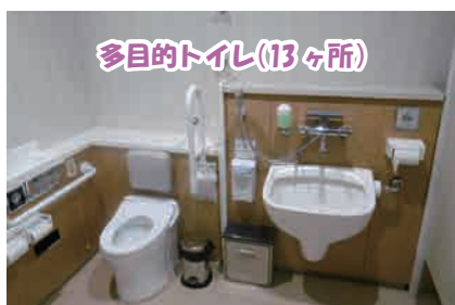
多目的トイレ(13ヶ所)