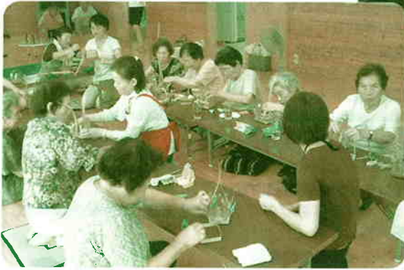
「手先を使って食事前の頭の体操」 —新町地区ふれあい会食会—