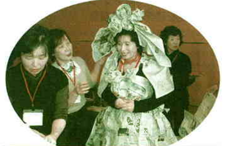
「新聞紙でドレスアップ」 —レクリエーションボランティア養成講座—

また市社協では、地域でレクリエーションを指導するボランティアを養成しており、昨年は42名の方が、地域へと巣立ちました。