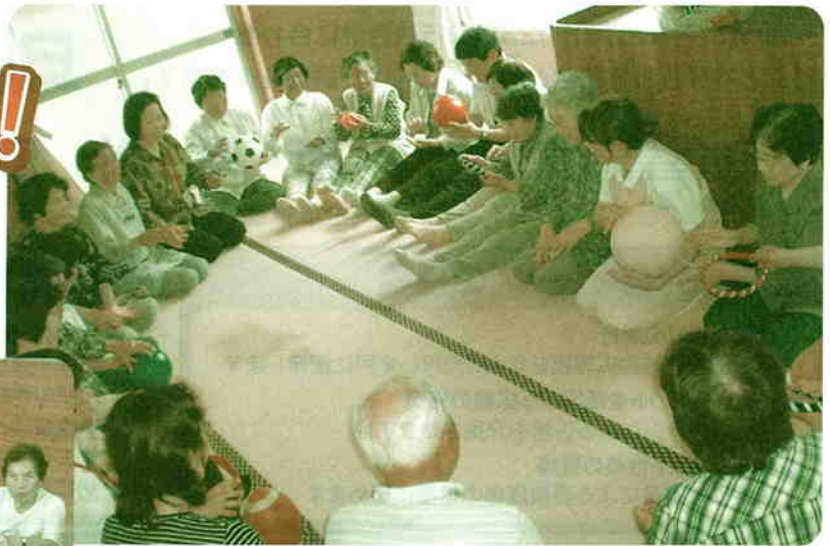
「ボールでつなぐ 仲間の輪」—鏡洲いきいきサロン—

高齢者等の閉じこもり防止や介護予防を目的として、各地区で住民が主体となった「ふれあいサロン」や「ふれあい会食会」の取り組みが盛んです。